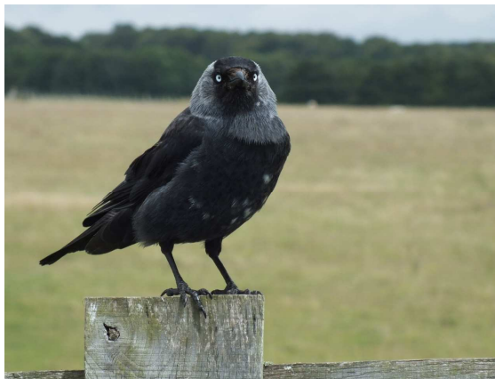
Abb. 1: Die Dohle ( Corvus monedula )

Die Dohle ist auf den ersten Blick ein eher unspektakulärer Vogel mit schwarzem Gefieder (Abb. 1). Auf den zweiten Blick aber reflektiert das Gefieder das Licht in schillernden Farben. Hinterkopf und Nacken sind grau-weiß. Dadurch unterscheidet sich die Dohle von ihren Verwandten wie Krähe, Kolkrabe und Co. Übrigens, aufgrund dieser hellen Partie hat die Dohle ihren lateinischen Artnamen erhalten – denn monedula bedeutet so viel wie „Mönchlein“. Recht eindrucksvoll sind auch ihre hellblauen bis fast weißen, durchdringenden Augen.