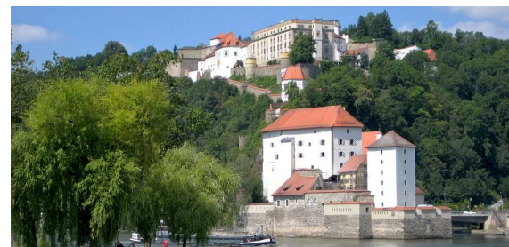
Abb. 3: Blick auf die Festungsanlage Nieder- und Oberhaus

Bei einem Spaziergang durch die Stadt Passau begegnet man immer wieder Dohlen. Begehrte Brutplätze im Stadtgebiet sind beispielsweise die Festungsanlagen Nieder- und Oberhaus (Abb. 3) oder die Eisenbahnbrücke über den Inn. Beliebte Übernachtungsplätze sind unter anderem beim Kraftwerk Kachlet. Der Dohlenbestand in der Stadt Passau wird vom Landesbund für Vogelschutz Passau auf mindestens 1000 Tiere geschätzt. Auch im Naturschutzgebiet Donauleiten zwischen Passau und Jochenstein trifft man immer wieder auf Dohlen. In den Hangwäldern der Donauleiten finden die Vögel alte Bäume mit Bruthöhlen und die angrenzenden Wiesen bieten ausreichend Nahrung.