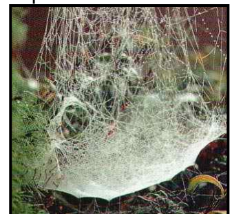
Baldachinnetz der Baldachinspinne

Spinnen ernähren sich von Insekten – es wird geschätzt, dass 1,5 Mio. Spinnen bei uns im Sommer mindestens 1.500 kg Insekten fressen. Sie erbeuten diese auf die unterschiedlichste Art– die bekannteste ist der Fang in Spinnennetzen. Man unterscheidet verschiedene Bauformen der Fangnetze: Radnetze, Baldachinnetze und Trichternetze. Viele Spinnen jagen ihre Beute jedoch ohne Netz: sie streifen wie die Wolfsspinne umher oder lauern wie die Krabbenspinne ihren Opfern auf.