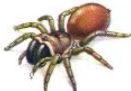
Tapezierspinne befreien, gegen Blitze schützen und vieles mehr.

Spinnen haben in allen Kulturen der Erde die unterschiedlichsten Bedeutungen: sie gelten als Glücksbringer und Todesboten, sind Krankheitsdämon und Medizin. Sie sollen das Wetter vorhersagen dienen als Orakel beim Glücksspiel, sollen vom Militärdienst