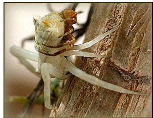
Paarung der einheimischen Krabbspinne: sie ist als Lauerjäger auf Blüten und Blättern zu finden