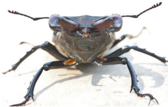
Abb. 1: Männlicher Hirschkäfer