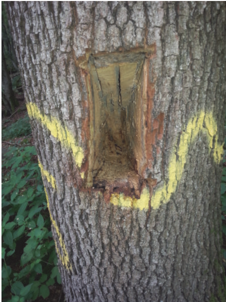
Abb. 2: Künstliche Baumhöhle in einer Eiche

und gedeihen. Es können dadurch jedoch wertvolle Strukturen für Baumhöhlen bewohnende Tiere (wie Vögel, Fledermäuse, Käfer etc.) entstehen, sobald Fäulnisprozesse eine oft beträchtliche Höhle im Inneren des Stammes entstehen lassen.