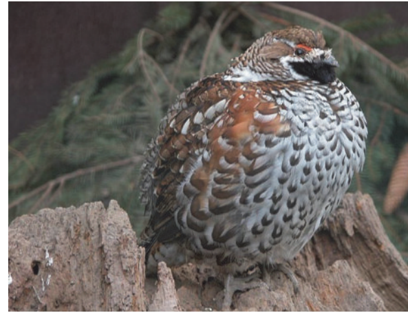
Abb. 3: Haselhahn